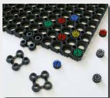
Brosses + jonctions